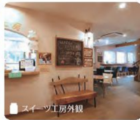
スイーツ工房外観