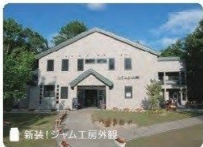
■ 新装! ジャム工房外観