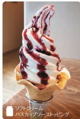
ソフトクリーム ハスキャップソーストッピング