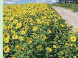
きれいな花のラインはまさに絶景。