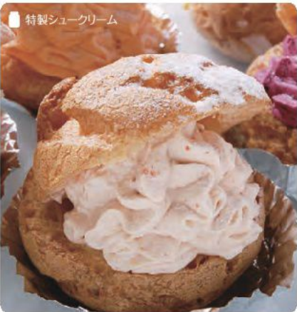
特製シュークリーム