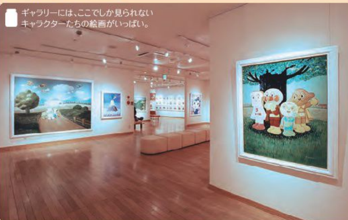
ギャラリーには、ここでしか見られないキャラクターたちの絵画がいっぱい。