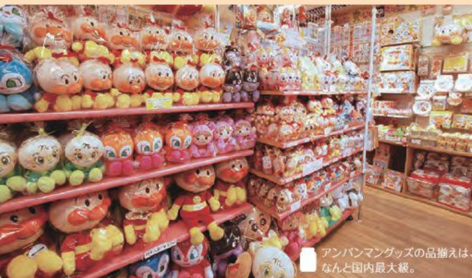
アンパンマングッズの品揃えは、なんと国内最大級。