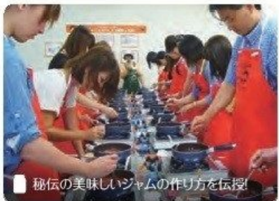
■ 秘伝の美味しいジャムの作り方を伝授!