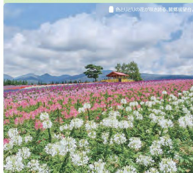
色とりどりの花が咲き誇る、麓郷展望台。

ショップ内にはアンパンマングッズがぎっしり！人気商品や定番アイテム、プレミアムな限定グッズまでお取り扱いしています。