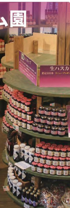
たくさんのジャムとドレッシング。見ているだけで楽しくなります。

昭和61年に開業以来、多くのお客様に親しまれてきたふらのジャム直営のショップです。大人気の手スキャップジャムをはじめ、果実系・ベリー系・野菜系など全38種類のジャムを試食しながらお買い求めいただけます。全国物産展でも好評の手スキャップドレッシングなどのドレッシングシリーズや、味噌、醤油漬けなどのお惣菜シリーズもずらりラインナップ。名実共に全国一の規模を誇るジャムワールドがあなたをお待ちしております。